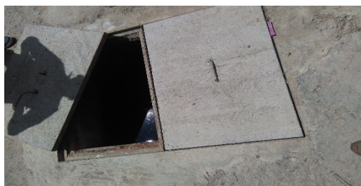
Imagen 6. Caja de inspección externa.