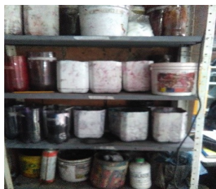
Imagen 7. Desechos resultantes de la producción, preparación y utilización de tintas, colorantes, pigmentos, pinturas, lacas o barnices.