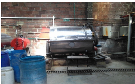
Imagen 3. Máquinas y equipos.