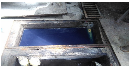
Imagen 5. Sistema de tratamiento primario-Sedimentador.