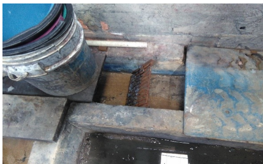
Imagen 4. Sistema de tratamiento preliminar-Rejillas.