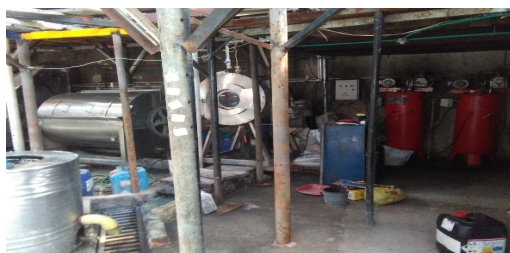
Imagen 8. Envases y contenedores de sustancias químicas usadas en el proceso productivo.